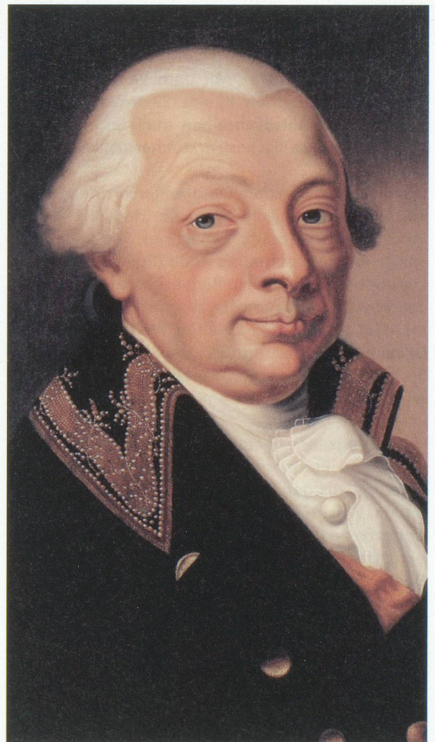
Karl Friedrich von Baden-Durlach

Der Freiburger Historiker und Politiker Karl von Rotteck brachte es auf den Punkt. «Ich will die Einheit [des Deutschen Reichs] nicht anders als mit Freiheit und will lieber Freiheit ohne Einheit als Einheit ohne Freiheit.» Der radikaldemokratische Flügel der Einigungsbewegung in Deutschland forderte