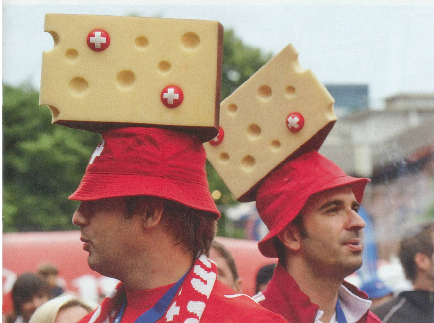
Schweizerzeit in Basel