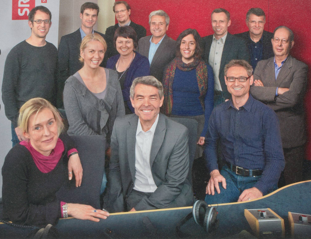
Das Team des Regionaljournals Basel Baselland

er reagiert, unmittelbar und ungefiltert von der Hörerin, dem Hörer wahrgenommen wird.