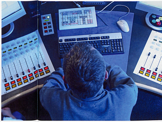
Bild links Der Tontechniker

Das weiss man natürlich auch beim Radio. Und so verfügt das Regionaljournal seit längerem über eine sehens-, Pardon: hörens-werte Homepage. Dort lassen sich nicht nur bereits gesendete Beiträge nachhören. Man kann sich auch mit einzelnen Themen auseinandersetzen, die in übersichtlichen Dossiers zusammengestellt sind. Ein besonderer Leckerbissen sind die unter dem Titel, «Hesch hört im Regi?» «Hesch hört im Regi?», zusammengefassten Stimmen von Zeitgenossinnen und -genossen, die sich zu politischen, wirtschaftlichen und kulturellen Themen äussern, welche die Menschen in der Region bewegen. Machen Sie sich selbst ein Bild davon und hören Sie hinein: www.regionaljournal.ch