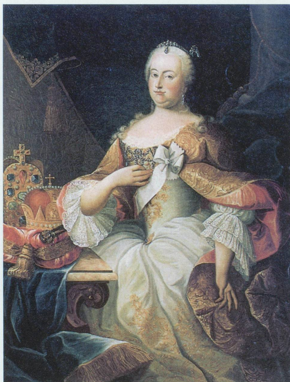
Bilder linke Seite Doppeladler Maria Theresia