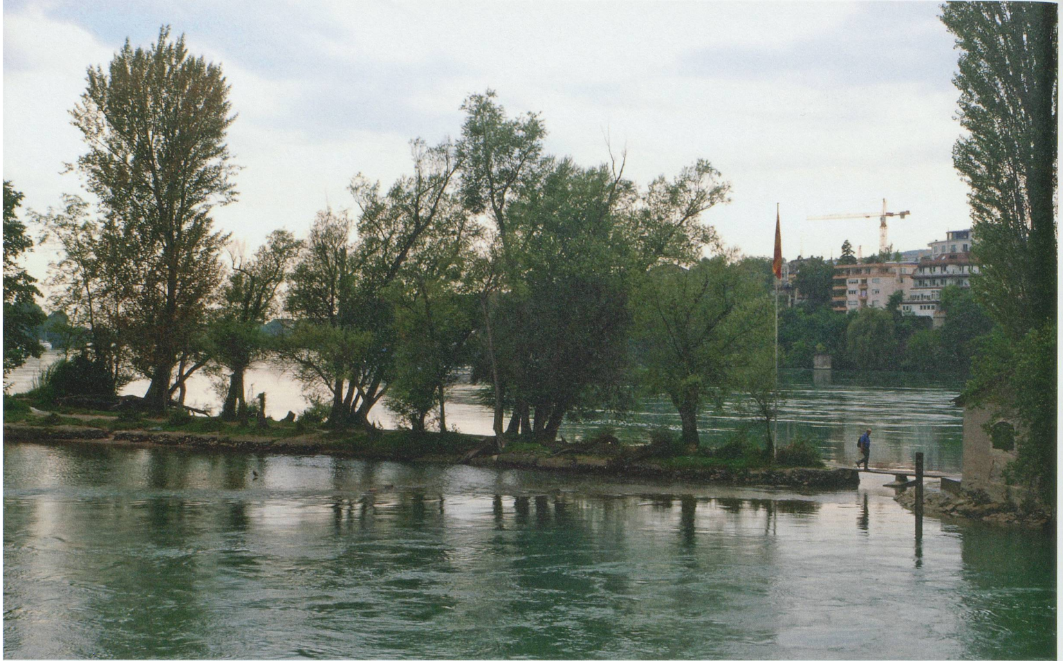
Inseli bei Rheinfelden