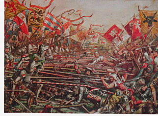
Karl Jauslin, 1889: Schlacht bei Sempach

1868, nach dem Tod seines Arbeitgebers, versuchte er, sich mit dem Bemalen von Ofenkacheln und Storen – der neueste Modetrend – über Wasser zu halten, denn seine Bilder fanden keine Käufer. Zum Glück für ihn, ist man geneigt zu sagen, brach der Deutsch-Französische Krieg aus: Der Stuttgarter Verleger der Familienzeitschrift «Über Land und Meer» brauchte dringend einen Illustrator, der Kriegsszenen zu Papier bringen konnte. Im Auftrag des Verlags