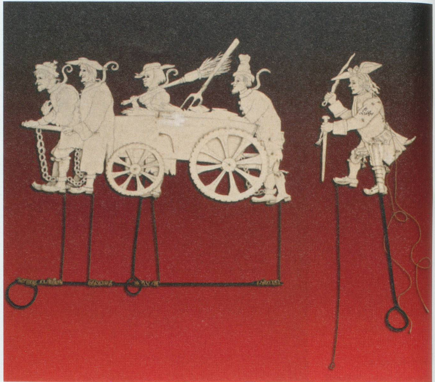
Massnahmenvollzug im 19. Jahrhundert oben Schellenwerker rechts Strafanstalt Schellenmätteli

Die Psychotherapie verfügt über Methoden zur Aufarbeitung und Bewältigung von Konflikten und ermöglicht einen anderen Umgang mit der Umwelt. Es werden Therapien angewandt, die Anpassungsmöglichkeiten an die Gesellschaft und ihre Normen aufzeigen und zu einem anderen Umgang mit der Aggressivität beitragen können. Vorrang haben intensive, störungsspezifische und deliktpräventive Einzelpsychotherapien sowie verschiedene, bewährte gruppentherapeutische Angebote. Dabei gilt der Grundsatz, dass die Behandlung immer in zwei Richtungen gehen muss: Einerseits geht es darum, die Störung, die den Betroffenen einengt und gefährlich macht, abzubauen. Andererseits geht es um den Schutz unschuldiger Mitmenschen vor den Folgen dieser Störung. Die in ihrer psychischen Entwicklung beeinträchtigten Straftäter werden im Massnahmenvollzug ständig überwacht. Sie haben es nicht leicht. Ihre Aussagen, ihre Gesten werden vom interdisziplinären Betreuungsteam registriert und diskutiert. Ist die unfreundliche Begrüssung heute Morgen auf eine schlechte Nacht zurückzuführen oder wird die Störung wieder stärker? Ist es verantwortbar, einen An-