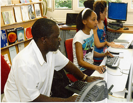
Bild oben Studenten im Schweizerischen Tropen- und Public Health Institut.

falls unter die ganz grossen «Killer». Künzli erinnert auch daran, dass vor allem in ärmeren Ländern die Luftverschmutzung oft katastrophale Ausmasse annimmt. «In diesen Ländern meinen viele, die Luftverschmutzung sei der Preis für den wirtschaftlichen Fortschritt. Wie wir aus allen westlichen Ländern wissen, stimmt dies in keiner Weise. Im Gegenteil: Die Folgekosten der durch die Luftverschmutzung verursachten Krankheiten sind sehr viel höher als die Kosten progressiver Luftreinhaltepolitik. In über 60 Ländern der Welt gehört die Innen- und Aussenluftverschmutzung heute zu den drei wichtigsten Ursachen verlorener Lebensjahre – in vielen Ländern ist