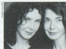
Katia und Marielle Labèque

A8 MITTWOCH, 4. JUNI 2014 B6 DONNERSTAG, 5. JUNI 2014