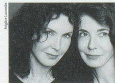
Katia und Marielle Labèque

A8 MITTWOCH, 4. JUNI 2014 B6 DONNERSTAG, 5. JUNI 2014