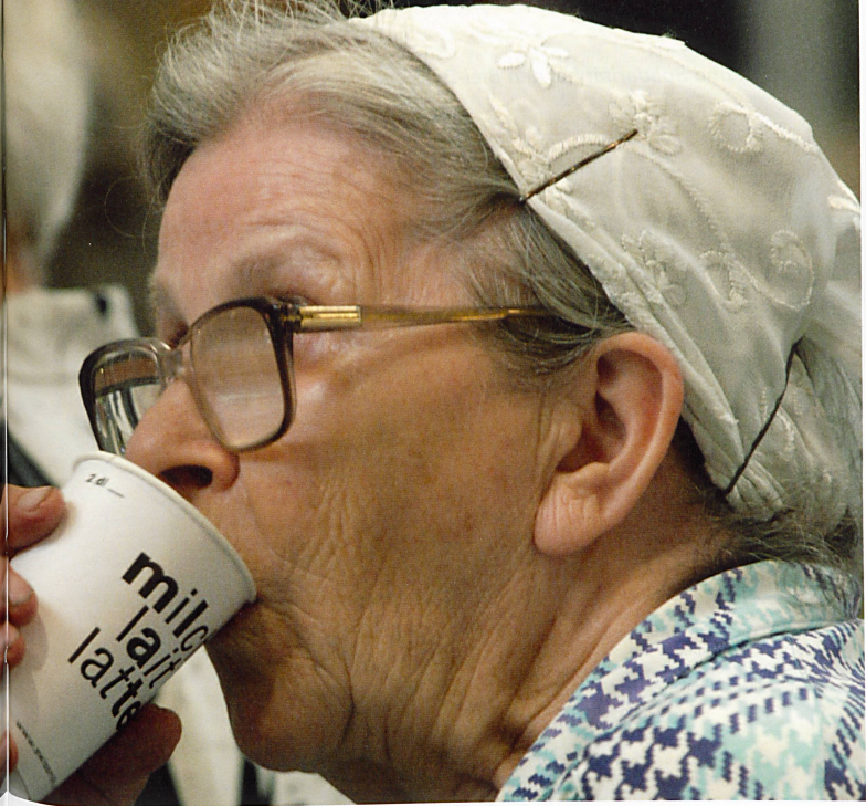
Milch: ein klassisches Genossenschaftsprodukt

ten können sich den aktuellen Wirtschaftstrends nicht entziehen, wenn sie in den sich permanent wandelnden Märkten bestehen wollen. Auch wenn der Rendite- und Aktienleistungsdruck nicht derart gross ist wie bei einer Aktiengesellschaft, so sind Zusammenschlüsse und Zukäufe zu grösseren schlagkräftigen Einheiten unabdingbar. Innovationen gehören heute zu einer erfolgreichen Genossenschaft wie der traditionelle Anteilschein. Die Schweizer Reisekasse (REKA) oder das Carsharing-Unternehmen Mobility sind, was Informationstechnik und modernste Marketingtools angeht, auf der Höhe der Zeit. Der Markt dankt es mit Wachstum. REKA steigerte den Umsatz in zehn Jahren um 70 Prozent. Mobility wächst noch schneller. Gerade in den Krisenjahren hat es sich gezeigt, dass Unternehmenswerte wie Nachhaltigkeit und Kundennutzen wieder wichtiger werden. Viele Genos-