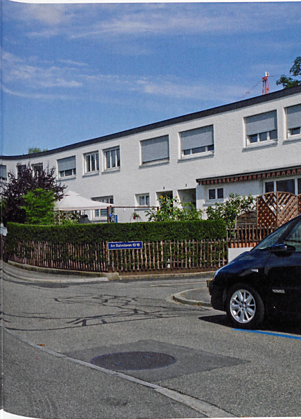
Bild unten Am Bahndamm