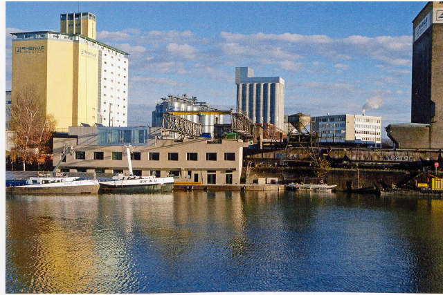
Bild links oben Vision Hafenbecken III