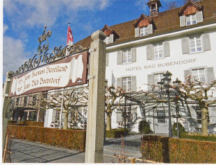
Bild links Bad Bubendorf, das «Rüti» des Kantons Basel-Landschaft

wurde, um noch einmal Martin Birmann zu zitieren, «die 1798 so unbefangene gegebene Verbindung beider Theile zu Einem Ganzen [...] völlig zerstört.»