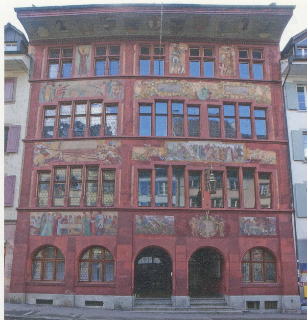
Bild rechts Rathaus Liestal

5. auf den 6. Januar neben dem damaligen Spital einen vier Meter hohen Freiheitsbaum aufrichten, dessen Spitze eine Jakobinermütze ziert. Der Durchzug Napoleons, scheint es, ist der Funke, der die Basler Revolution von 1798 in Gang bringt.