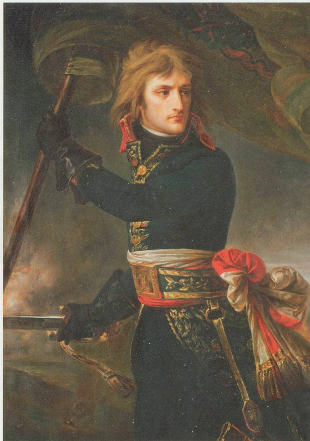
Bild rechts Bonaparte Brücke von Arcole, 1801 von Antoine-Jean Gros

Wer sich mit der Baselbieter Geschichte im letzten Jahrzehnt des 18. Jahrhunderts beschäftigt, wundert sich, weshalb die Landschäftler Untertanen nicht gegen das Ancien Regime rebellieren, während im Frankreich von 1789, im Namen von Freiheit, Gleichheit und Brüderlichkeit, die alte Ordnung weggefegt wird; während im August 1792 in Paris der Pöbel die Schweizergarde massakriert; während man im Januar 1793 König Ludwig XVI. den Kopf vor die Füsse legt und im Oktober auch seine Frau, Marie Antoinette guillotiniert; während das neue Frankreich den