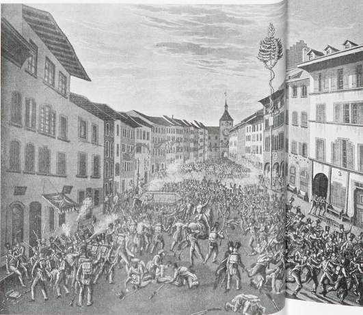
april | maj akzent magazin

Auch in einer zweiten Abstimmung brachte die Landbevölkerung ihren Willen zum Ausdruck, bei der Stadt zu verbleiben. Allerdings verweigerten sämtliche Bürger von Liestal und Muttenz, sowie einiger Dörfer aus dem Birseck, geschlossen die Teilnahme am Urnengang. In der Folge sah sich die Obrigkeit bemüht, jenen 46 Gemeinden, in denen keine Mehrheit für das Verbleiben bei der Stadt zustande gekommen war, die Verwaltung zu entziehen, sie also de facto aus dem Kanton auszuschliessen. Mit diesem wenig Weisen Entscheid besiegelte eine Regierung, der es an jeglichem Fingerspitzengefühl fehlte, die Trennung eines Lebensraumes, der über Jahrhunderte hinweg eine Einheit gewesen war. Die Folgen sind bekannt: Die Auseinandersetzung nahm eine Eigendynamik an, die letztlich mit militärischer Gewalt und Blutvergiessen, zu einem Resultat führte, das ursprünglich niemand so gewollt hatte. Es entstanden