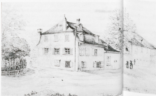
Birmann'sches Landgut vor dem Spalentor