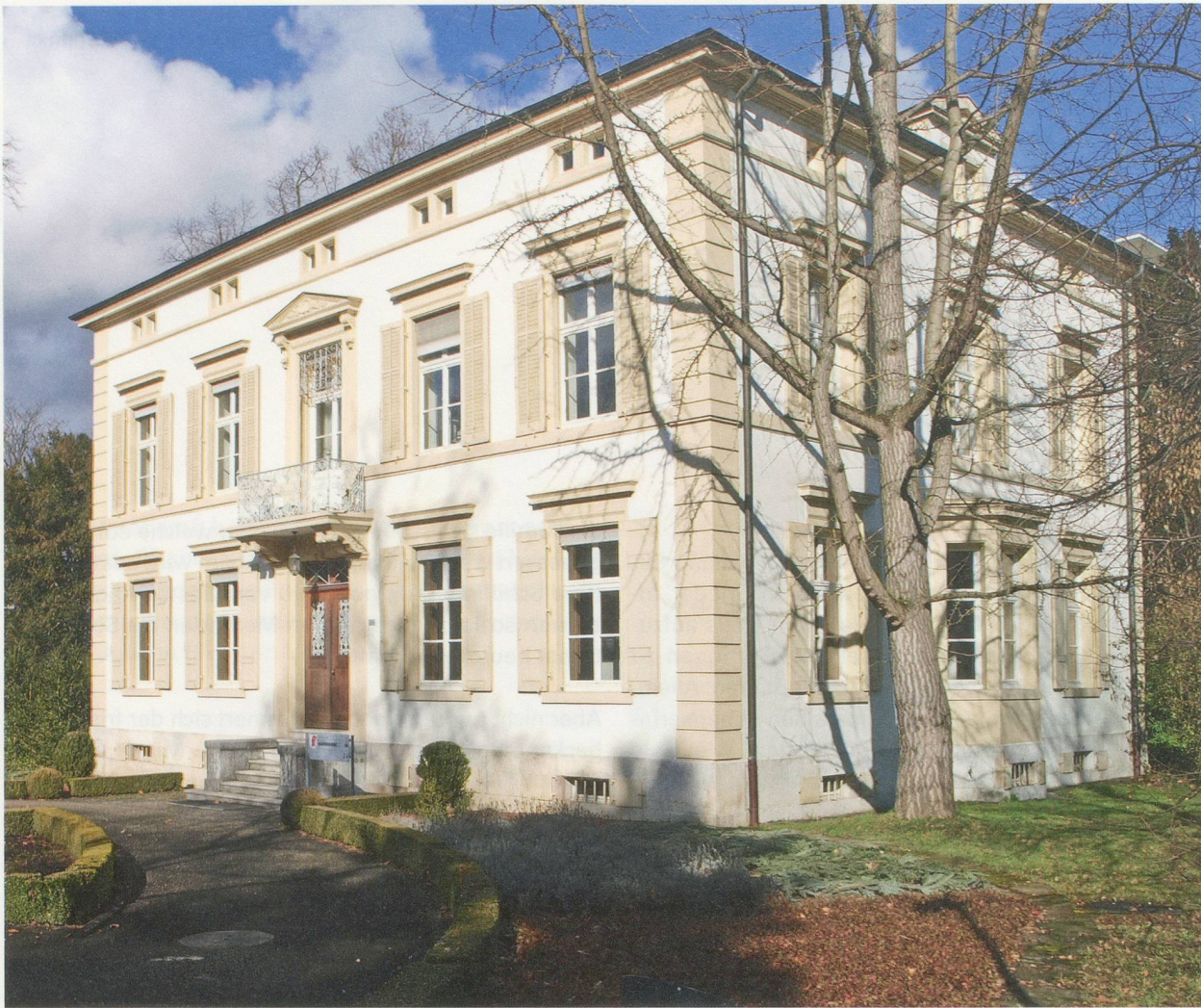
Birmann'sche Villa in Liestal

Artikel in die von ihm mitgegründete «Basellandschaftliche Zeitung», verfasst geschichtliche Aufsätze und gibt die «Blätter zur Heimatkunde von Baselland» heraus. Die Universität Basel verleiht ihm den Ehrendoktor für seine Bemühungen als Vermittler des geistigen Verkehrs zwischen Baselland und Baselstadt».