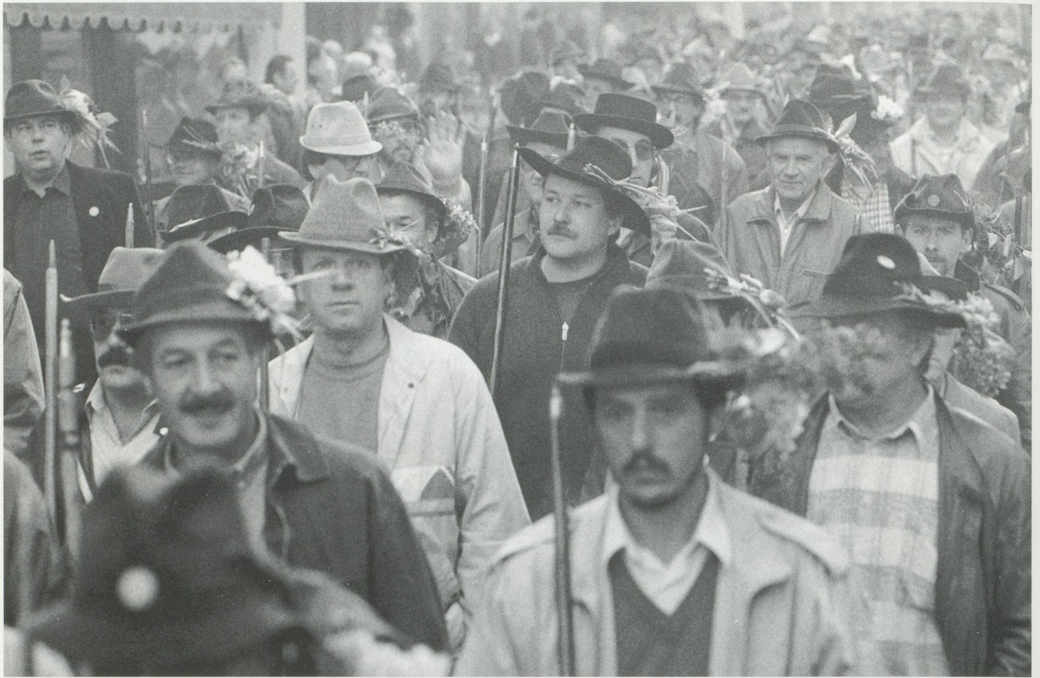
Impressionen vom Banntag 1986

Schliesslich nähten sich die aufständischen Frauen des 20. Jahrhunderts ihre eigene Fahne und gründeten eine fünfte Rotte – die Familienrotte – welche zwei Jahre lang unter Buhrufen am Banntag teilnahm, ehe sie ihr Picknick auf Auffahrt verlegte. Inzwischen ist dieser neue Brauch wieder zum Erliegen gekommen.