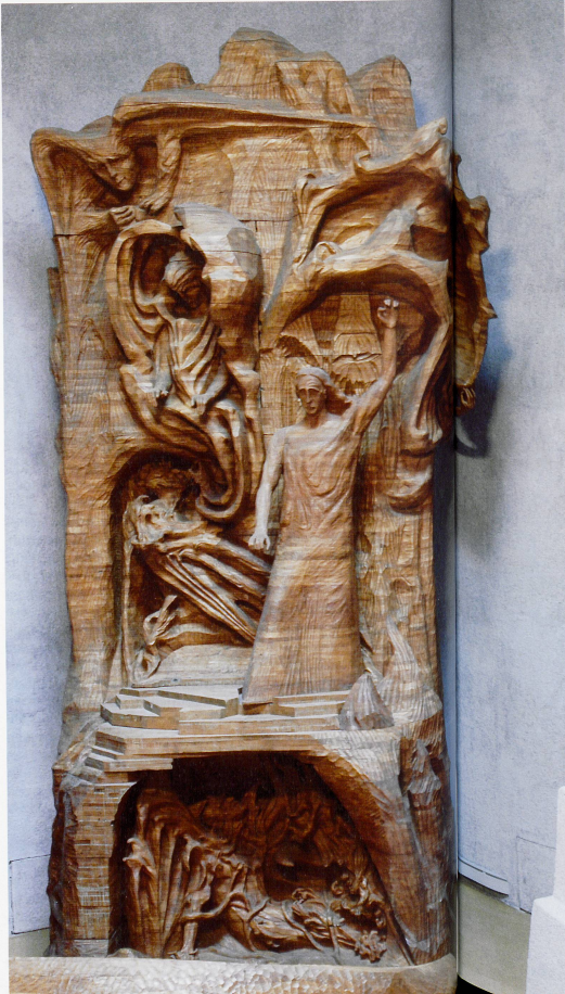
Der Menschheits-repräsentant zwischen Luzifer und Ahriman

In unserer rationalen und rationellen Lebenswelt, die überzeugt ist, alles sei messbar und (fast) alles machbar, befremdet das Gedankengut der Anthroposophie