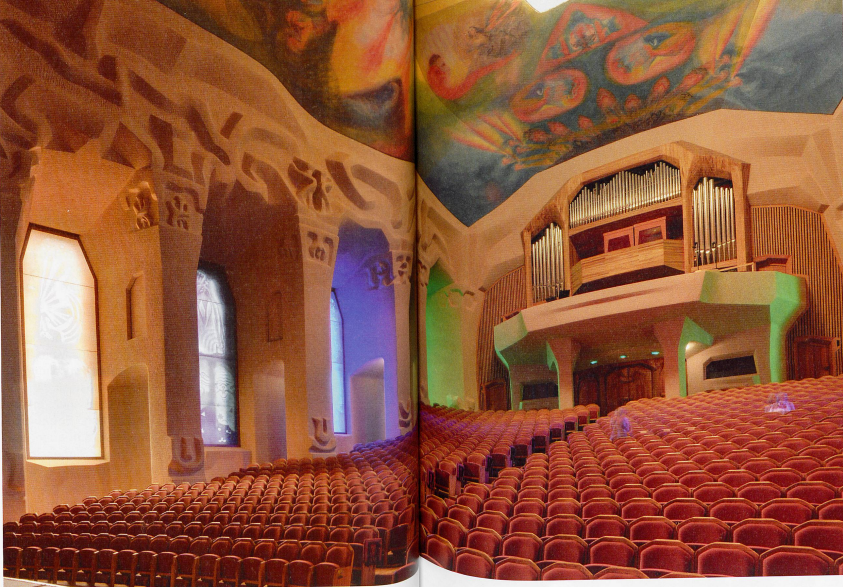
Der grosse Saal im Goetheanum

In Anlehnung an die ums Jahr 500 entstandene Schrift «Über die himmlische Hierarchie» eines neuplatonischen Autors, der als Pseudonym den Namen Dionysius Areopagita (vom Apostel Paulus bekehrter, erster Bischof von Athen) angenommen hatte, beschrieb