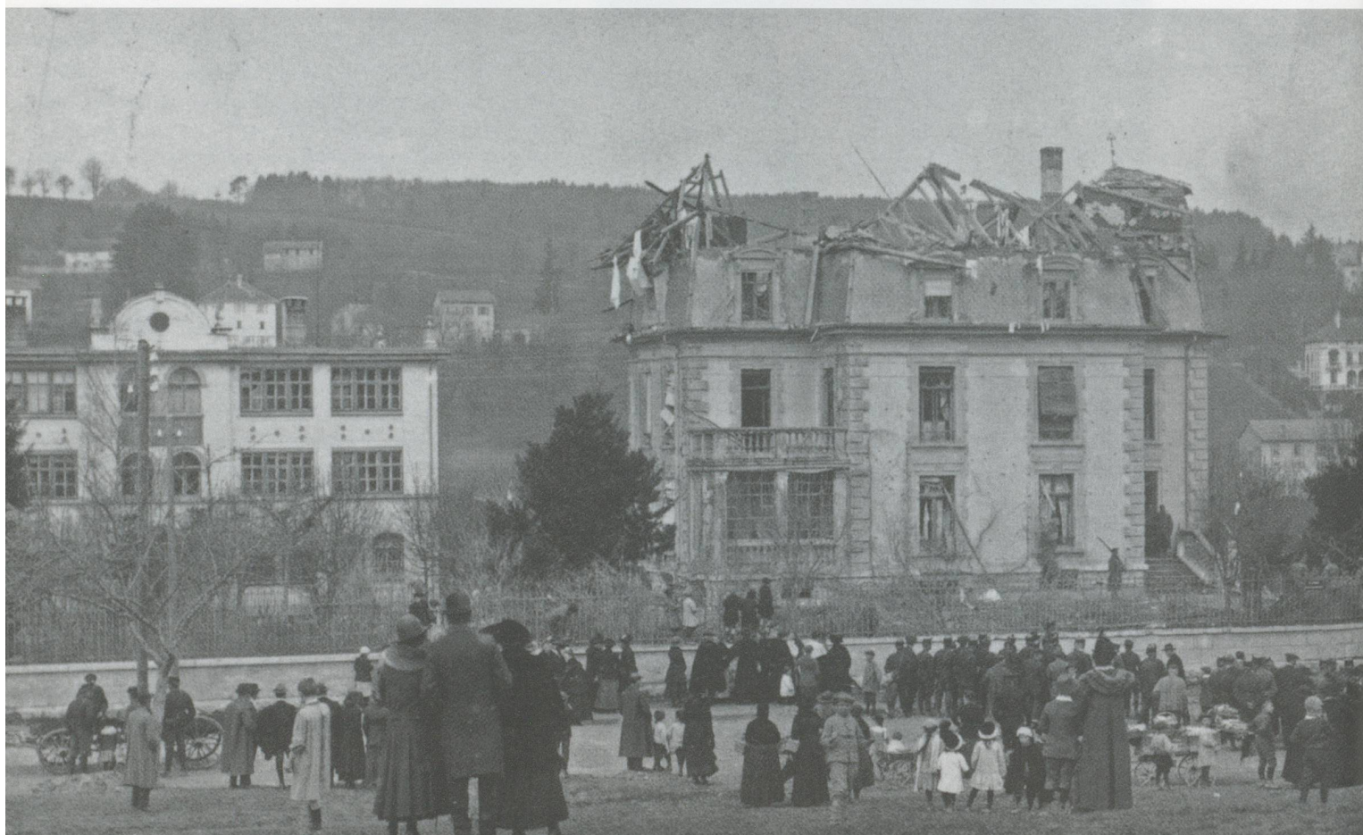
Bild unten Bombardierung von Pruntrut

Bei der Diskussion des Gotthardvertrags zwei Jahre vor Ausbruch des Krieges, den die Gegner als Ausverkauf der Alpenbahn an das Deutsche Reich brandmarken, werden die Spannungen auch im Parlament deutlich. Von einer Kluft zwischen Deutschschweiz und Romandie ist die Rede. Spannungen auch in der Militärpolitik. Die Armeespitze, nicht zuletzt Divisionär Ulrich Wille, will eine Reform der Schweizer Armee nach preussischem Muster. Es kommt zu mehreren Abstimmungsschlachten, bei denen sich Deutschschweizer Zentralisten und welsche Föderalisten gegenüberstehen. In den Auseinandersetzungen zwischen welscher und deutscher Schweiz erwirbt sich Wille, der mit einer Gräfin von Bismarck verheiratet ist, die Reputation eines fanatischen Deutschland-Bewunderers.