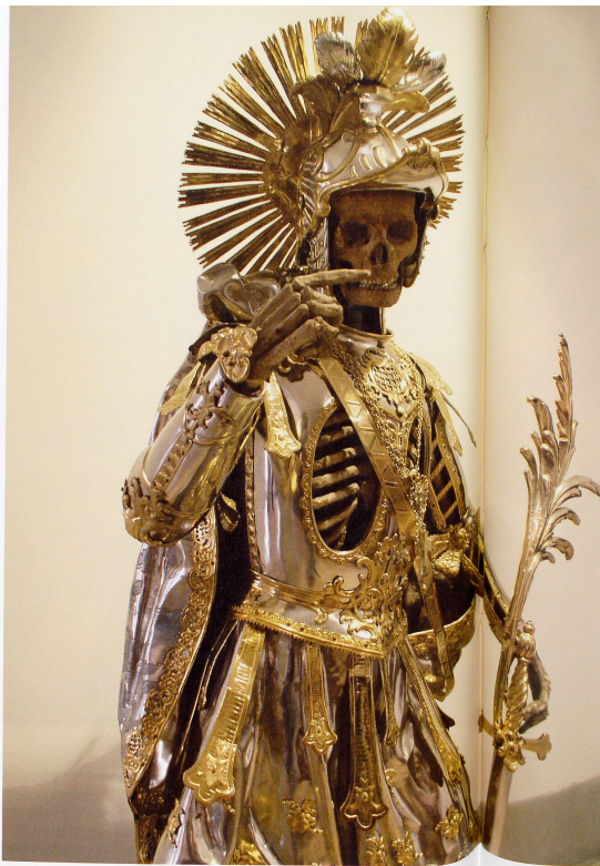
Heiliger Pankratus (Reliquie)

Die reformierte Ablehnung von Bildwerk, Reliquien und Amuletten, von Weihrauch und goldbestickten Messgewändern ist verstehbar als eine Reaktion auf die spätmittelalterliche katholische Kirche, die ihre überbordende Prunkentfaltung weitgehend mit dem Ablasshandel finanzierte. Aber mit der Fokussierung der Reformatoren auf das Wort allein wurden möglicherweise die Bedürfnisse des Volkes nach sinnlicher Erfahrung des Glaubens zu rigide beschnitten. Wenn Pater Leonhard bekennt: «Für uns Katholiken ist Glaube immer mehr als etwas rein Geistiges, er hat auch damit zu tun was ich berühre, schmecke, höre ...», so meint er, dass für den Glauben dasselbe gilt wie für die Liebe: Seele und Leib gehören zusammen und müssen gleichermaßen angesprochen werden. Der reformierte Münsterpfarrer stellt die Berechtigung dieses Bedürfnisses nicht in Abrede. Darüber hinaus ist er der Auffassung, dass die Ästhetik in der Religion möglicherweise eine weit wichtigere Rolle spiele, «als wir Reformierten bisher glaubten». Tatsächlich hängt in seinem Büro eine Ikone, ein kleines Kunstwerk: das