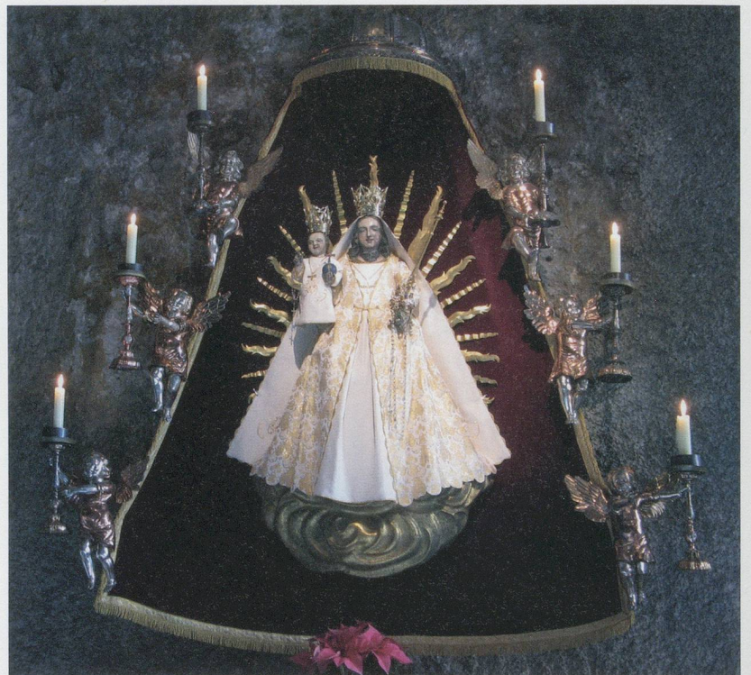
Maria im Stein

Für Angehörige von Migrationsgemeinden ist die Wallfahrt nach Mariastein, die ihre Priester jährlich einmal für sie organisieren, nicht nur von spiritueller, sondern auch von sozialer Bedeutung. Im Anschluss an die Messe, die in ihrer Sprache gelesen