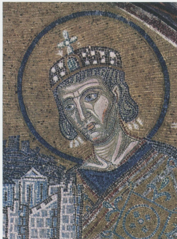
Berühmte Konvertiten von links Paulus Konstantin der Grosse Heinrich IV Heinrich VIII