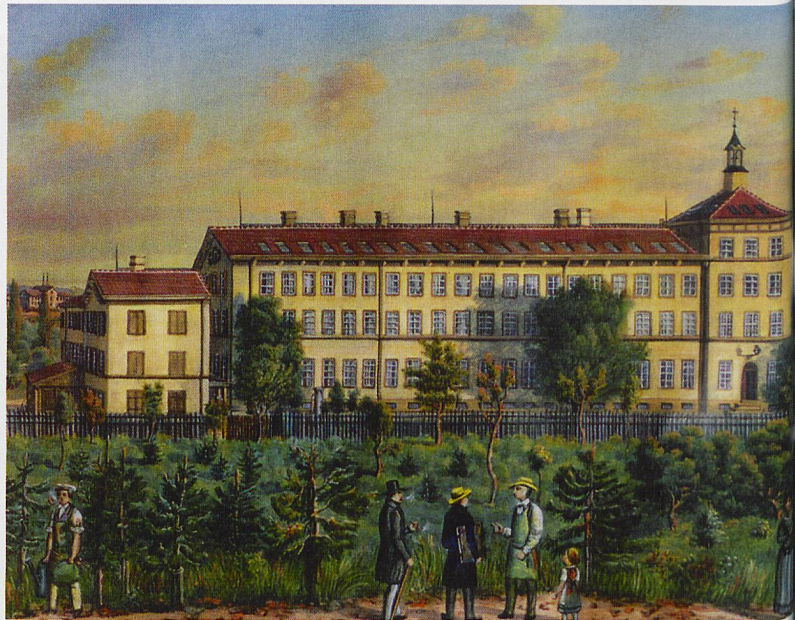
Eine idealisierende Darstellung der neu erbauten Seidenbandfabrik De Bary & Söhne (1854).

Heinz Polivka: Nein. Sie handelten mit allem: Getreide, Wein, Salz, Tabak, Baumwolle, Zucker, Kaffee, Metallen, Farbwaren, Käse, gedörtem Obst, Holz, Vieh