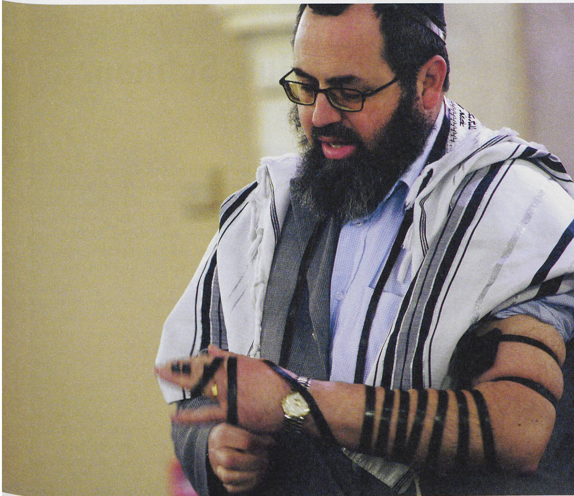
Aus der jüdischen Gemeinde, Basel, 2006