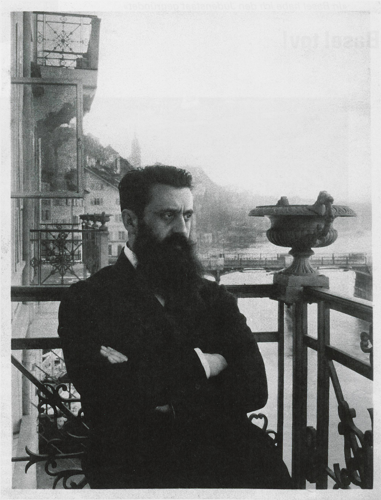
Theodor Herzl in Basel