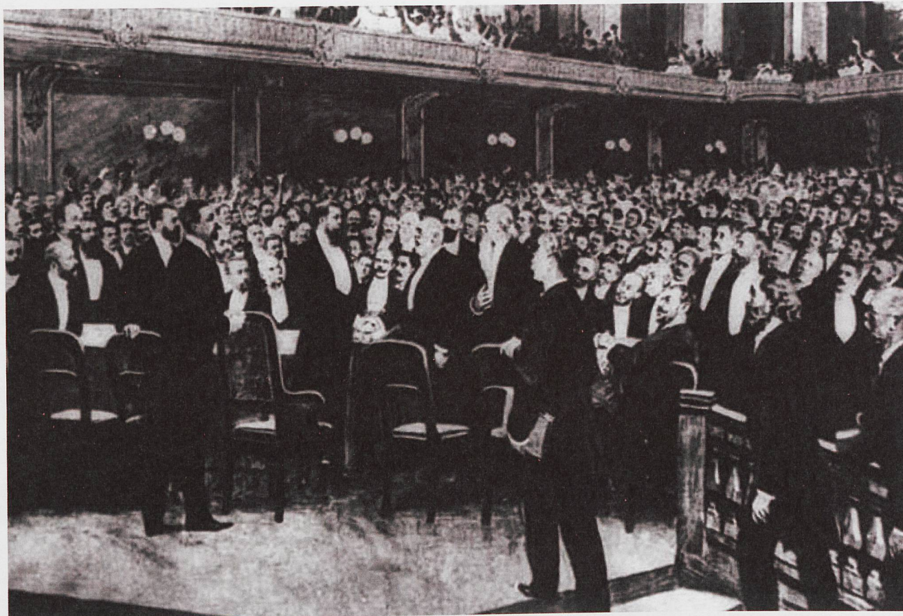
Zionistenkongress 1897 in Basel

In Wien, wo er lebte, haben ihn manche als Spinner empfunden. Tatsächlich war er ein Visionär, der lange vor der Gründung Israels von einem Judenstaat träumte. Wer in dreissig Jahren Recht behalten wollte, notierte Theodor Herzl in sein Tagebuch, müsse zunächst für verrückt erklärt werden.