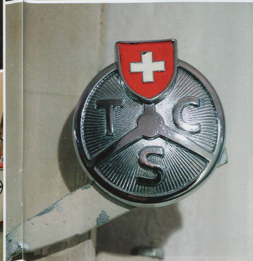
◀ Der Sammler auf einer alten Lambretta in der heimischen Garage: Das Prunkstück seiner «Blech»-Sammlung ist der zweitürige Packard Clipper Coupé von 1955 (•), vermutlich der Einzige seiner Art in der Schweiz. Die amerikanische Autofirma aus Detroit stellte ihre Produktion 1958 ein.