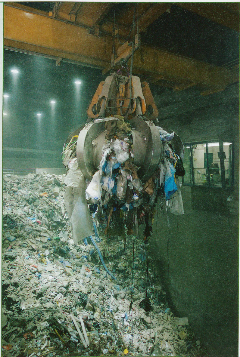
Greifer im Müllbunker.

Weitere interessante Führungen finden Sie auf Seite 50.