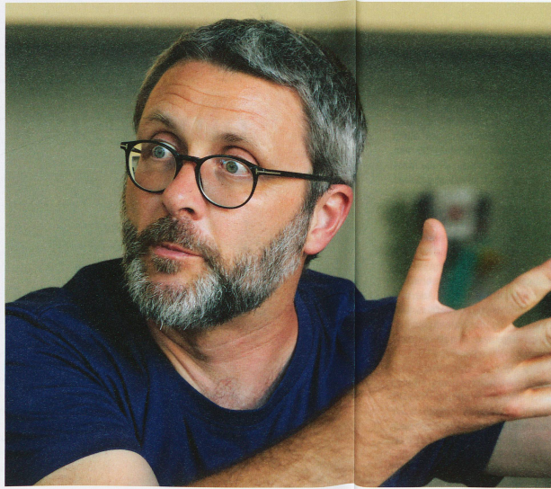
... in der Universitätsbibliothek in Basel.

Man könnte sagen, dass es in der Philosophie mehr als einen Körper gibt. So sprechen einige Philosophen und Philosophinnen davon, dass wir neben dem Körper auch einen Leib besitzen. Das wirkt auf den ersten Blick etwas seltsam. Sind Leib und Körper denn nicht dasselbe?