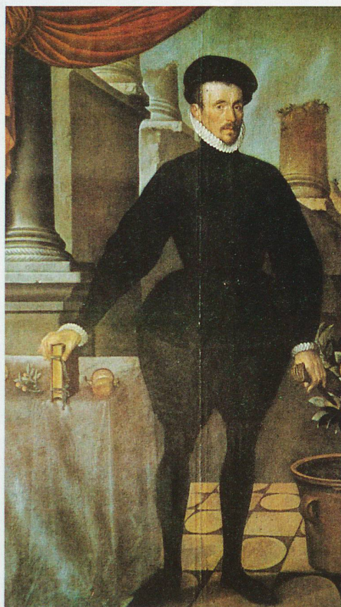
Porträt des Felix Platter (1536–1614)

19. September, 19.30 Uhr, Museum Kleines Klingental, Basel, mkk.ch