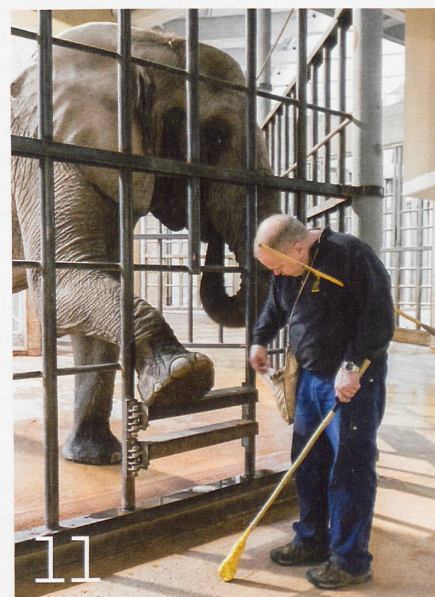
Brauchen Zootiere Krafttraining?