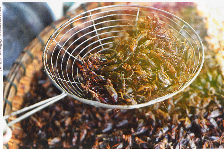
Insekten zum Z'nacht?

Für über zwei Milliarden Menschen weltweit gehören Insekten schon lange zum festen Speiseplan. Inzwischen werden Insekten wie Würmer oder Grillen in mehreren Varianten auch in der Schweiz angeboten. Als Pionier hierzulande hat Coop die Regale damit aufgefüllt. Der Detaillist arbeitet auf diesem Gebiet eng mit dem Start-up-Unternehmen Essento zusammen und brachte 2017 den ersten Insekten-Burger auf den Markt. Zur weiteren Produktpalette zählen nach Angaben von Essento auch Insect Balls (Hackbällchen), der Insect Bar – ein Energie-Fruchtriegel mit Grillenmehl – sowie Snacks mit Nüssen und ganzen Insekten.