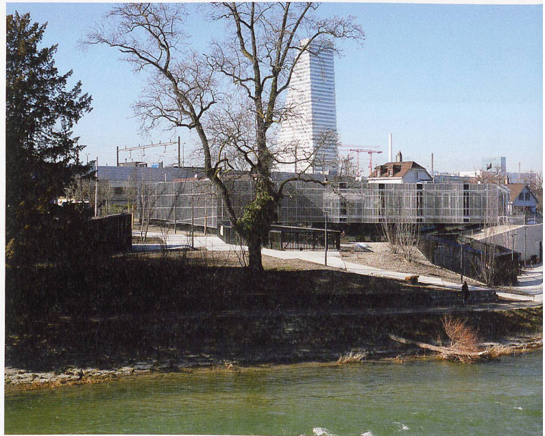
Der Neubau an der Birs am alten Standort

In den Anfängen des Tierschutzes in der Region ging es um Kutscher, Bauern und Kinder und deren Umgang mit der unschuldigen Kreatur. Die Fuhrleute im Basel des 19. Jahrhunderts tendierten zum Überladen ihrer Gefährte und zum entsprechenden Schinden der davor gespannten Pferde. Die Landwirte banden Kälbern auf der Fahrt zum Schlachthof die Füsse zusammen, liessen ihre Köpfe über den Wagenrand hängen und trichterten ihnen kurz vor dem Gang auf die Metzgerwaage noch literweise Wasser ein, um ihr Gewicht und damit den Schlachtpreis anzuheben. Und die Jugend schliesslich vergnügte sich schon damals mit lustvollen Quälereien von allerlei Lebewesen, deren Beine zum Ausreissen und Schwänze zum Anzünden reizten.