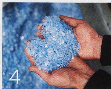
4 Plastik aus dem Meer