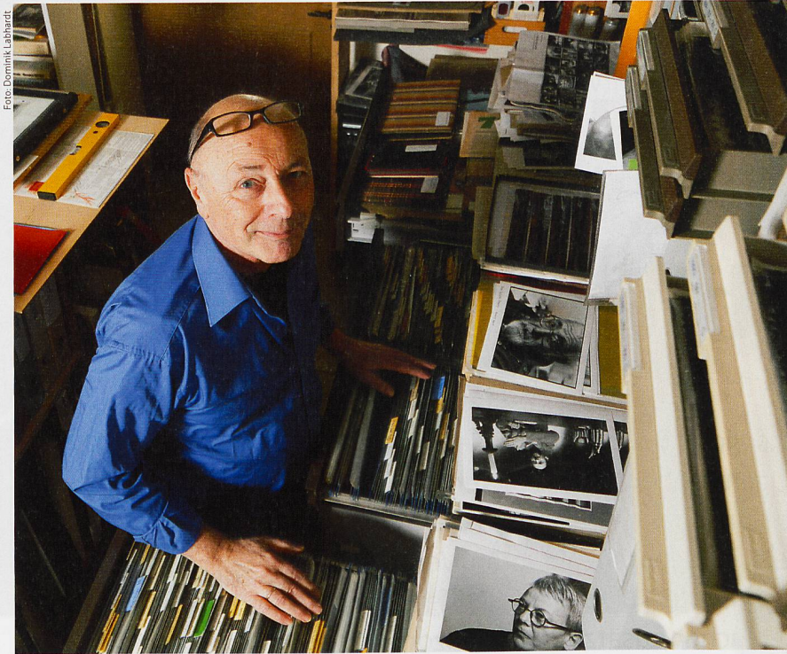
Viel Zeitgeschichte befindet sich im Archiv von Claude Giger.