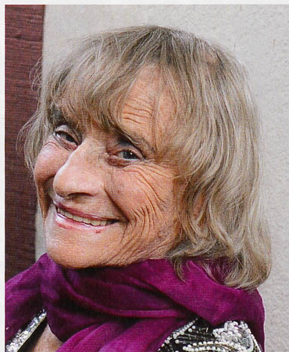
Trudi Gerster, 2009, Foto: 00llar1e79/Wikicommons

→ spo.ch/angebote/elektronisches-patientendossier/