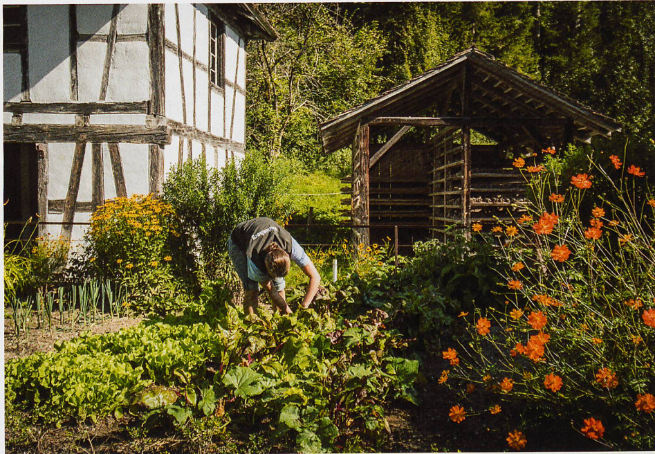
Gemüse- und Kräutergarten auf dem Ballenberg