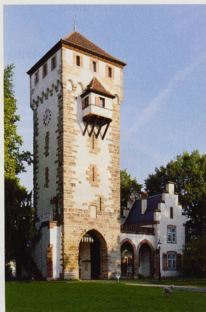
Das St. Alban-Tor einst ein Teil der Stadtmauer

Mi, 29. April, 18.30 Uhr Vortrag und Führung durch die Gartenbaubibliothek, → heimatschutz-bs.ch