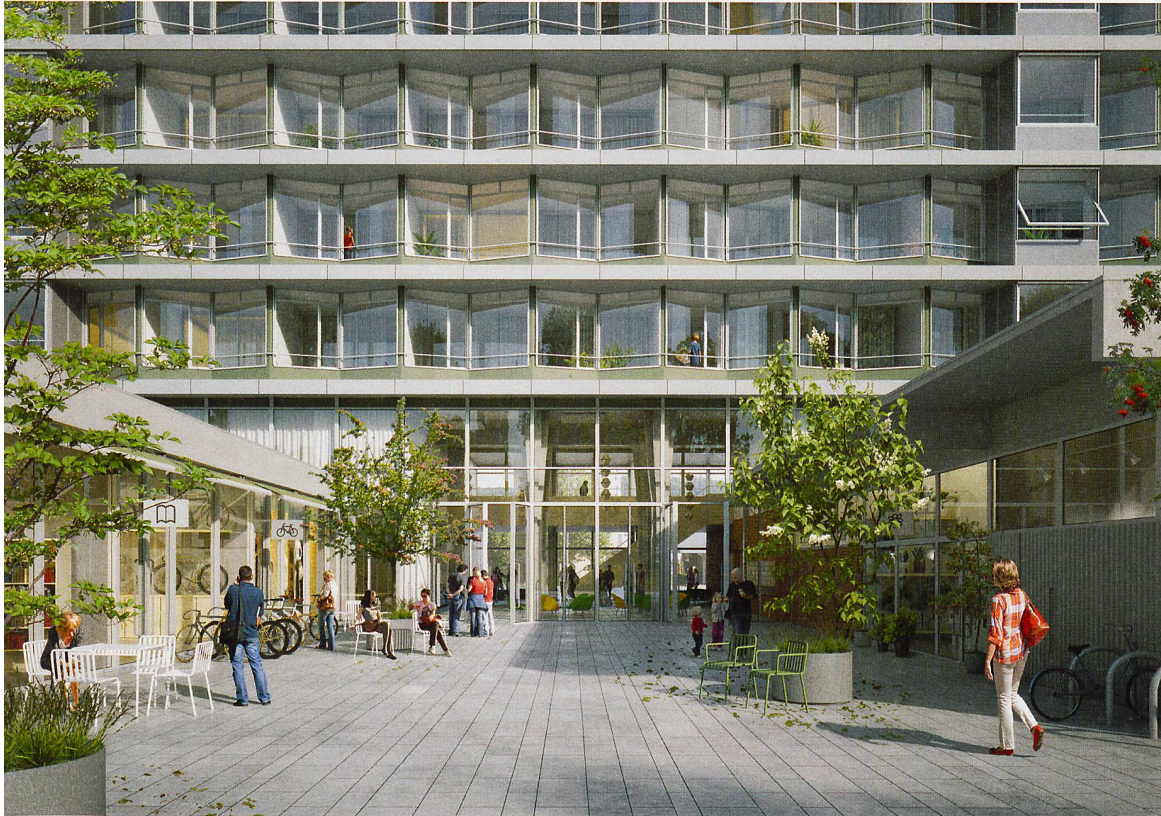
Visualisierung: Felix Pfäfer-Spöhrli, Ausschnitt: Müller/Sigrist/Repp

Im Westfeld gibt es für die Quartierbevölkerung nicht nur Wohnungen, sondern auch Dienstleistungen, Einkaufsmöglichkeiten und Treffpunkte.