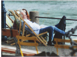
◀ Chillen am Fluss – kleine Fluchten bei der Kaffeebar am Unteren Rheinweg

ARA-gereinigten Strom in den letzten Jahrzehnten zum sommerlichen Volkssport. Dies nicht zuletzt dank dem begleiteten «offiziellen» Rheinschwimmen, das seit dem Jahr 1980 jeweils am ersten Dienstag nach Schulbeginn stattfindet. Vor vierzig Jahren gingen die Bilder von den Hundertschaften, die sich dabei auf ihren farbenfrohen Schwimmsäcken dicht an dicht von der Strömung den «Bach» hinuntertreiben liessen, um die Welt und dienten dem Basler Stadtmarketing als werbewirksames Argument für die hohe Lebensqualität der Stadt. Heute würde Hebel sein Loblied auf Basel wohl anders beginnen. Etwa so: «Z'Basel in mym Rhy, jo, dort möcht y syy. Schwimm im Wasser, blau und klar. Und am Rhybord wartet d'Bar. An mym liebe, in mym kieh-le Rhy!» ■