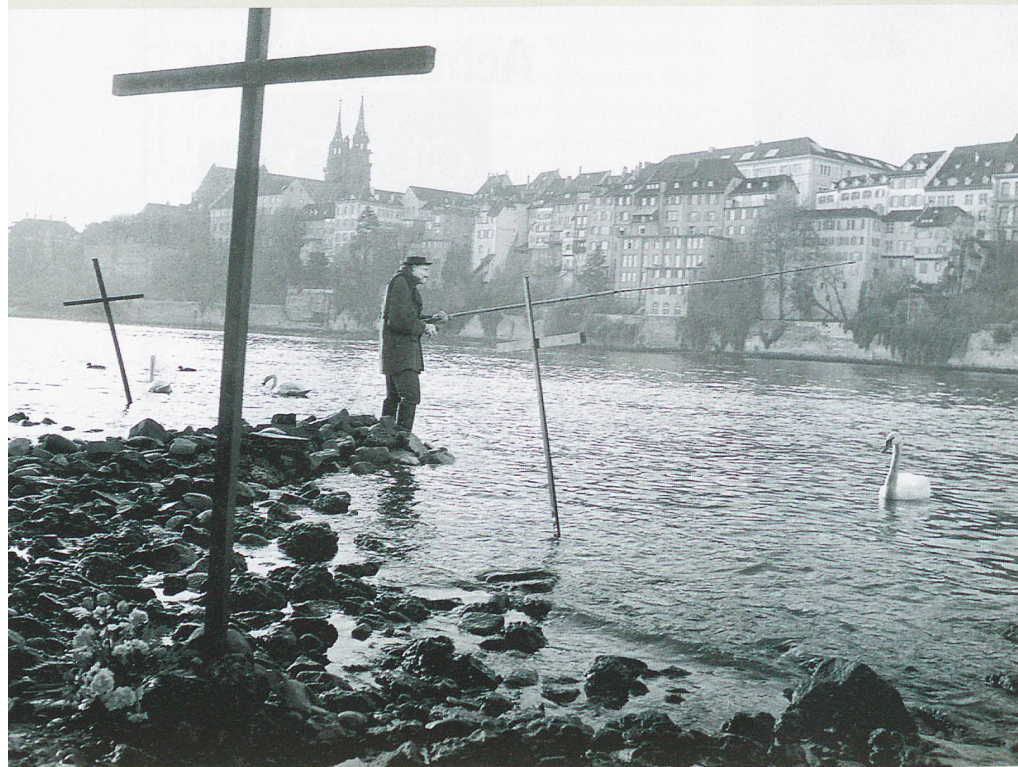
Mahnmal im Rhein bei der Mittleren Brücke: Bis in den Mittelrhein bei Bonn starben allein etwa 150 000 Aale aufgrund der 30 Tonnen Pflanzenschutzmittel, die mit dem Löschwasser in den Fluss gelangten.