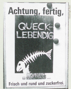
Nach der Brandnacht überklebten Studentinnen und Studenten der damaligen Kunstgewerbeschule in einer Protestaktion die Litfass-Säulen der Stadt mit aufreißenden Plakaten. Die Bilder zeugen von der Angst und Empörung der Bevölkerung.

Wie können wir die Fenster abdichten? Gemeinsam informieren wir die anderen Hausbewohner und verabreden uns zu einer Lagebesprechung. Bis dahin alarmiere ich per Telefon meine Mutter, die in Pratteln lebt. Danach ist die Leitung tot.