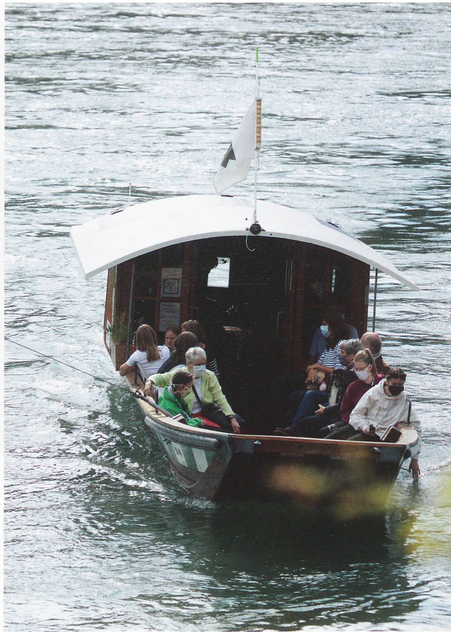
Trotz frischer Luft: Auch auf der Fähre schützt man sich und die anderen sinnvollerweise mit einer Maske vor dem Coronavirus.