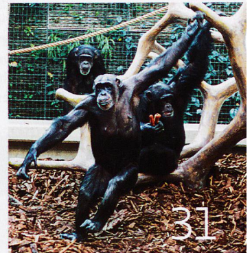
Familienbande bei den Primaten

Titelfoto: Simone Forcart-Staehelin