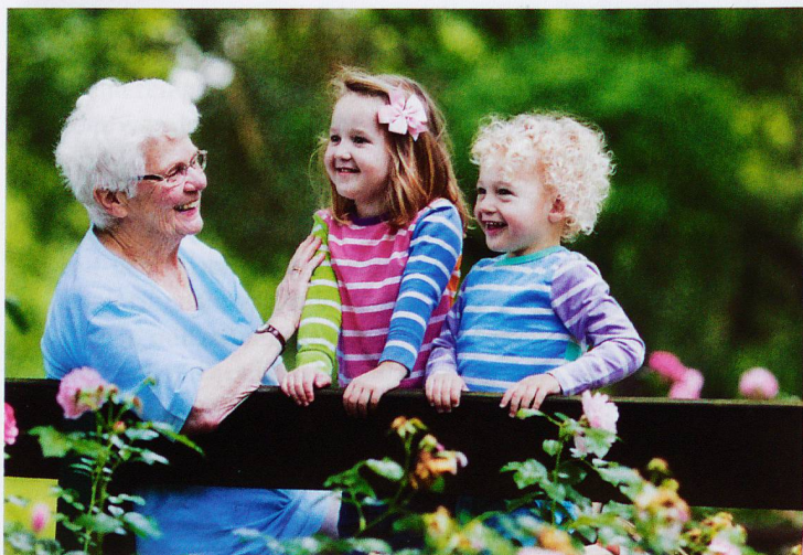
Die Kinder der Tochter haben unterschiedliche Väter? Das neue Erbrecht trägt den veränderten Familienformen Rechnung.

Des einen Leid ist des anderen Freud: «Die Möglichkeiten, aussenstehende Personen oder etwa gemeinnützige Institutionen zu begünstigen, werden infolge der gekürzten erbrechtlichen Pflichtteile zunehmen», betont Sauter. So können neu etwa Konkubinatspartner ohne (pflichtteilgeschützte) Kinder einander in Zukunft den ganzen Nachlass vererben. Nach aktuell geltendem Recht ist dieser Nachlass duetlich geringer: Wenn die Eltern des Erblassers noch leben, erhält der