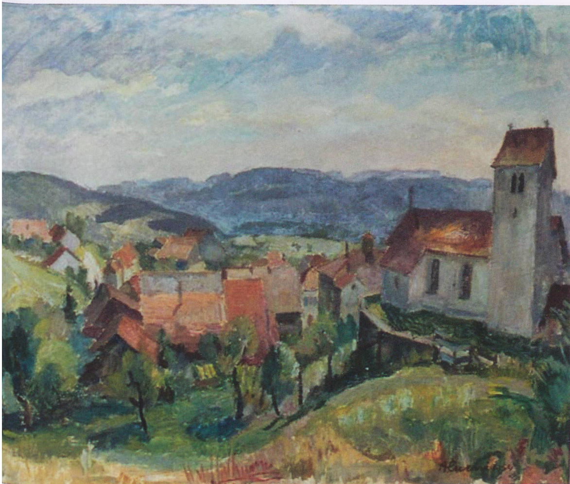
August Cueni: Blauen, Dorfpartie mit Kirche, 1935