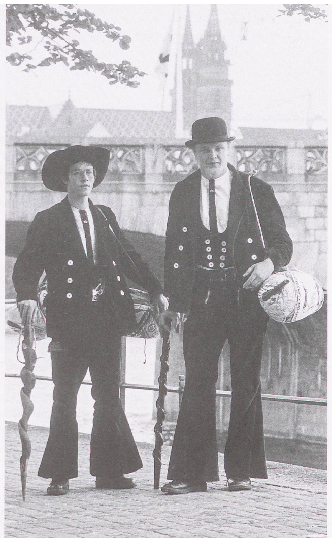
Ende Mai 1980: Viele reisende Handwerksge­sell­en besuchten damals Basel für den traditionellen zweitägigen Kongress.