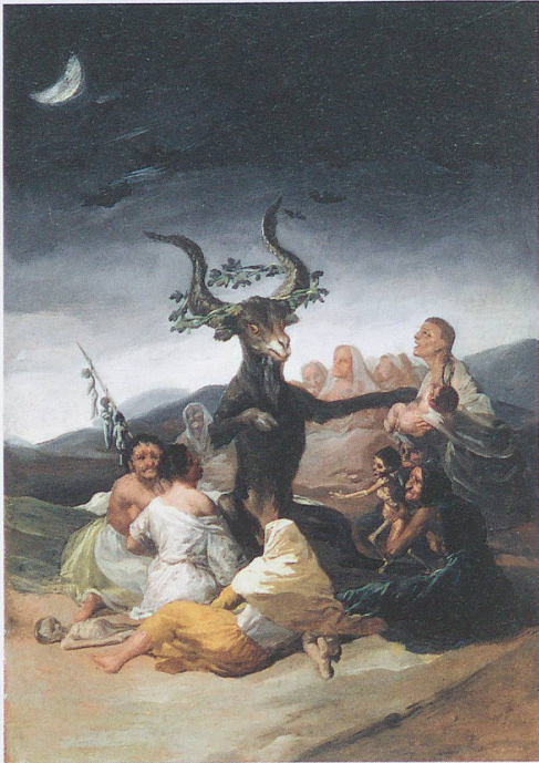
Francisco de Goya: Hexensabbat (El aquelarre), 1797/98