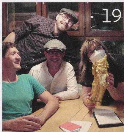
Erster Preis für die meisten richtigen Antworten im Pubquiz: der goldene Gartenzweig