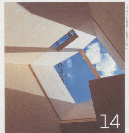
Neues altes Bauen mit nachhaltigen Materialien in Basel