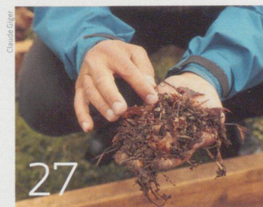
Ökologische und resiliente Landwirtschaft ist möglich.