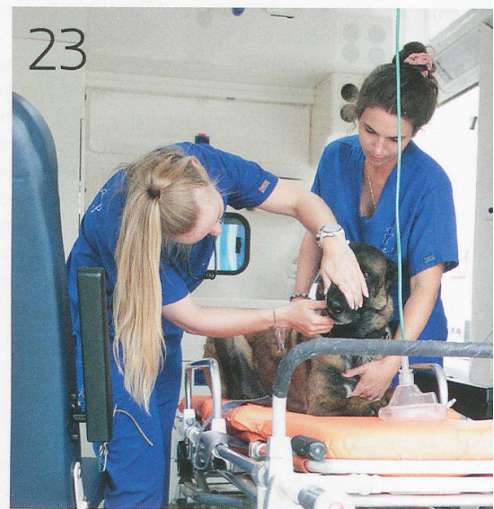
Notfallhilfe für Vierbeiner