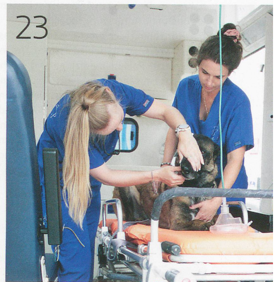
Notfallhilfe für Vierbeiner