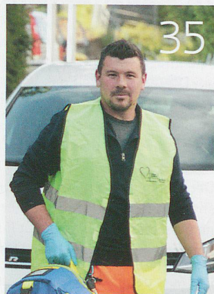
Lebensretter in Zivil