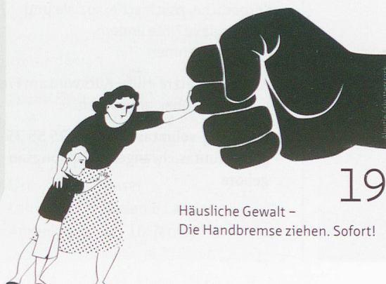
Häusliche Gewalt – Die Handbremse ziehen. Sofort!