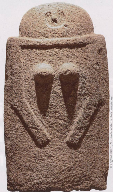
Moncigoli I aus Fivizzano in der Toskana. Der Sandstein, der 1910 gefunden wurde, datiert vom 3. Jahrtausend vor Christus.

Schweizerisches Nationalmuseum (Hg.): «Menschen in Stein gemeisselt» Christoph Merian Verlag, Basel 2021 ISBN 978-3-85616-961-9