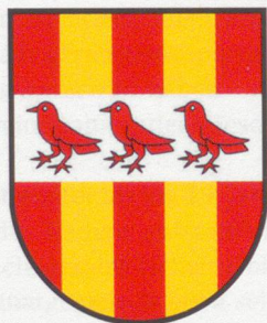
▲ Ederswiler (JU) Das Wappen zeigt drei Spatzen.