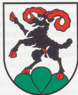
▲ Roggenburg (BL) Herkunft und Deutung des Wappens sind nicht bekannt. Es wurde von der Gemeinde 1944 angenommen.

Hier oben, beim «Habschällestübli», der Besenbeiz, die jeweils am Wochenende geöffnet hat, sieht man an schönen Tagen über Hügel und Täler bis weit ins Laufental. Hier berührt nur ein einzelner Punkt, genauer, ein Grenzstein, die beiden Kantongrenzen. Wo sonst die Grenze entlang dem Kanton Solothurn verläuft, treffen an