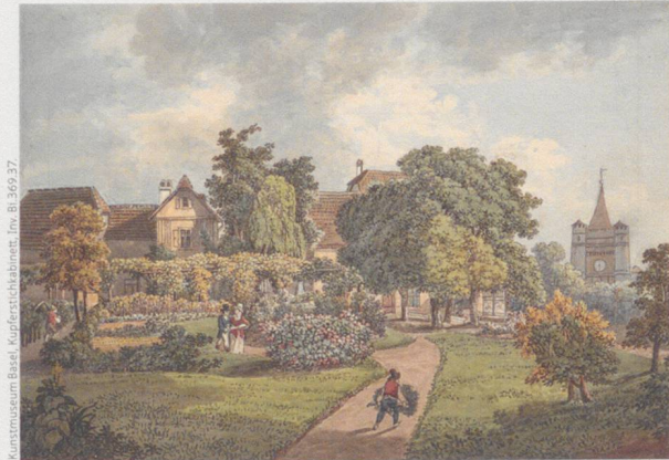
◀ Peter Birmann: Biedermeiergarten vor dem Spalenter, um 1840