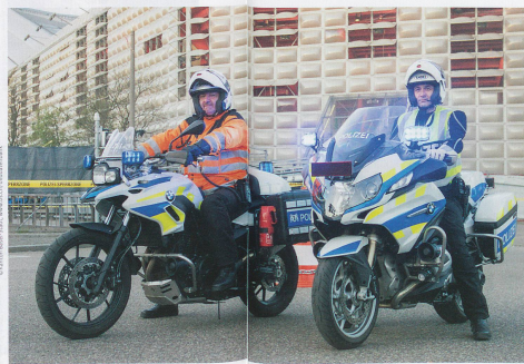
▲ Ein häufiger Einsatzort: das Stadion St. Jakob bei Fussballspielen ◀ Auch Kontrollen am Bahnhof SBB gehören zum Alltag der Polizei.