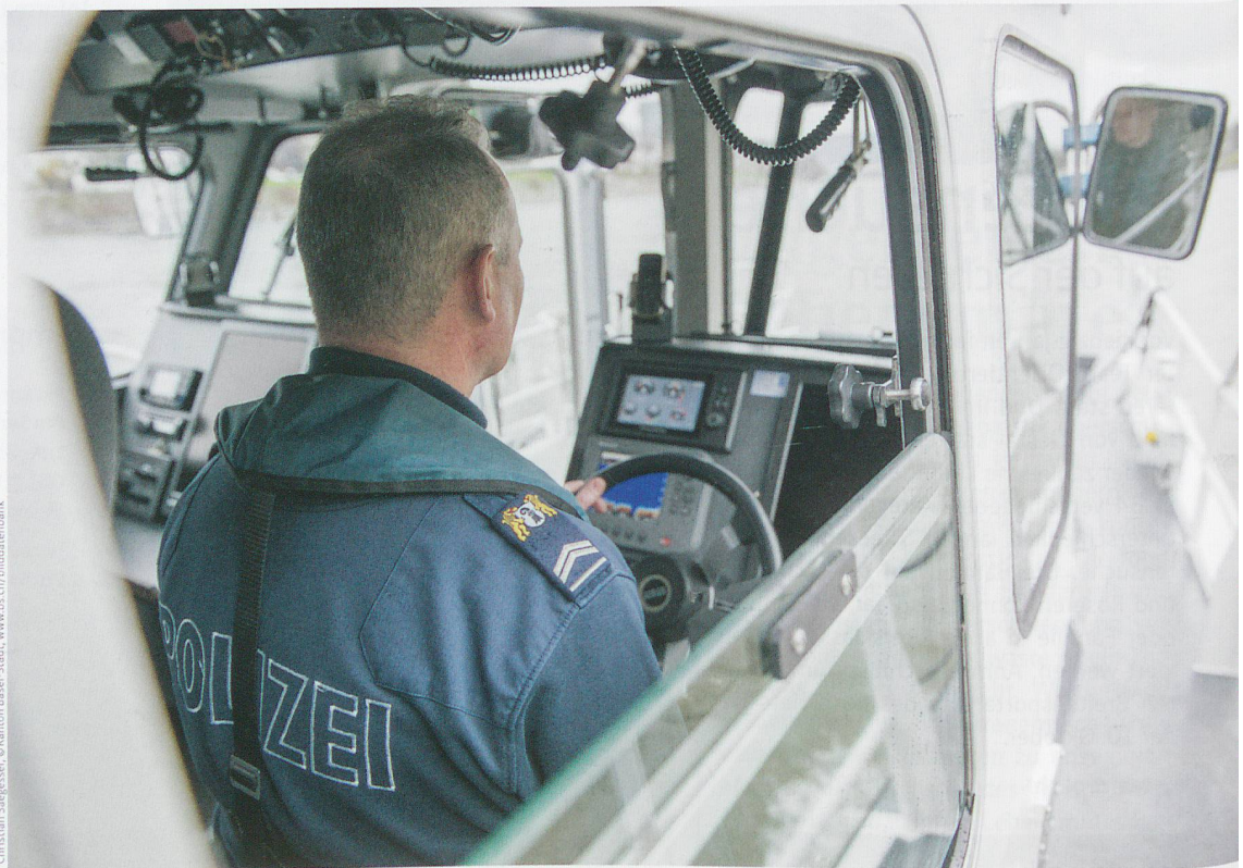
Christian Staegasser, © Kanton Basel-Stadt, www.bs.ch/bildatbank