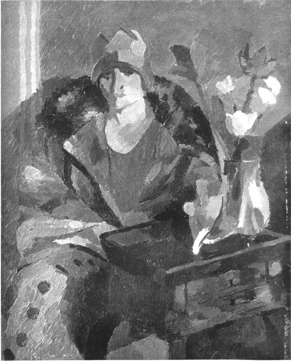
CURT MANZ / BILDNIS