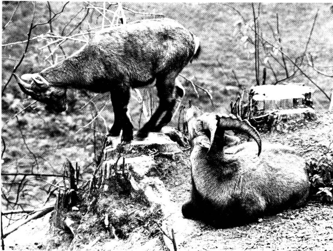
Steinwildpaar, eingesetzt am 15. Juni 1978

schossen werden muss, werden alle Ausreisser wieder zurückgetrieben. Das Wildparkkomitee fasst den Entschluss, die Schutz- und Futterhütten einer eingehenden Renovation zu unterziehen und zum Teil neu zu errichten. Die Kosten belaufen sich voraussichtlich auf rund 70 000 Franken. Das Parkgitter wird instand gestellt. Vor allem der Zaun um die Aufforstung herum muss repariert werden, da bereits schwerwiegende Schälsschäden entstanden sind und zahlreiche Bäume absterben. Die Ortsbürger bestätigen in der Urnenabstimmung vom 2. Juli den Beschluss der Ortsbürgergemeindeversammlung vom 5. Juni, wonach für den Umbau der Wirtschaft ein Baukredit von Fr. 1 592 000.– bewilligt wird. An der Versammlung stimmen 127 Ortsbürger dafür, 47 dagegen; an der Urnenabstimmung sind es 454 Ja-Stimmen gegen 98 Nein-Stimmen.