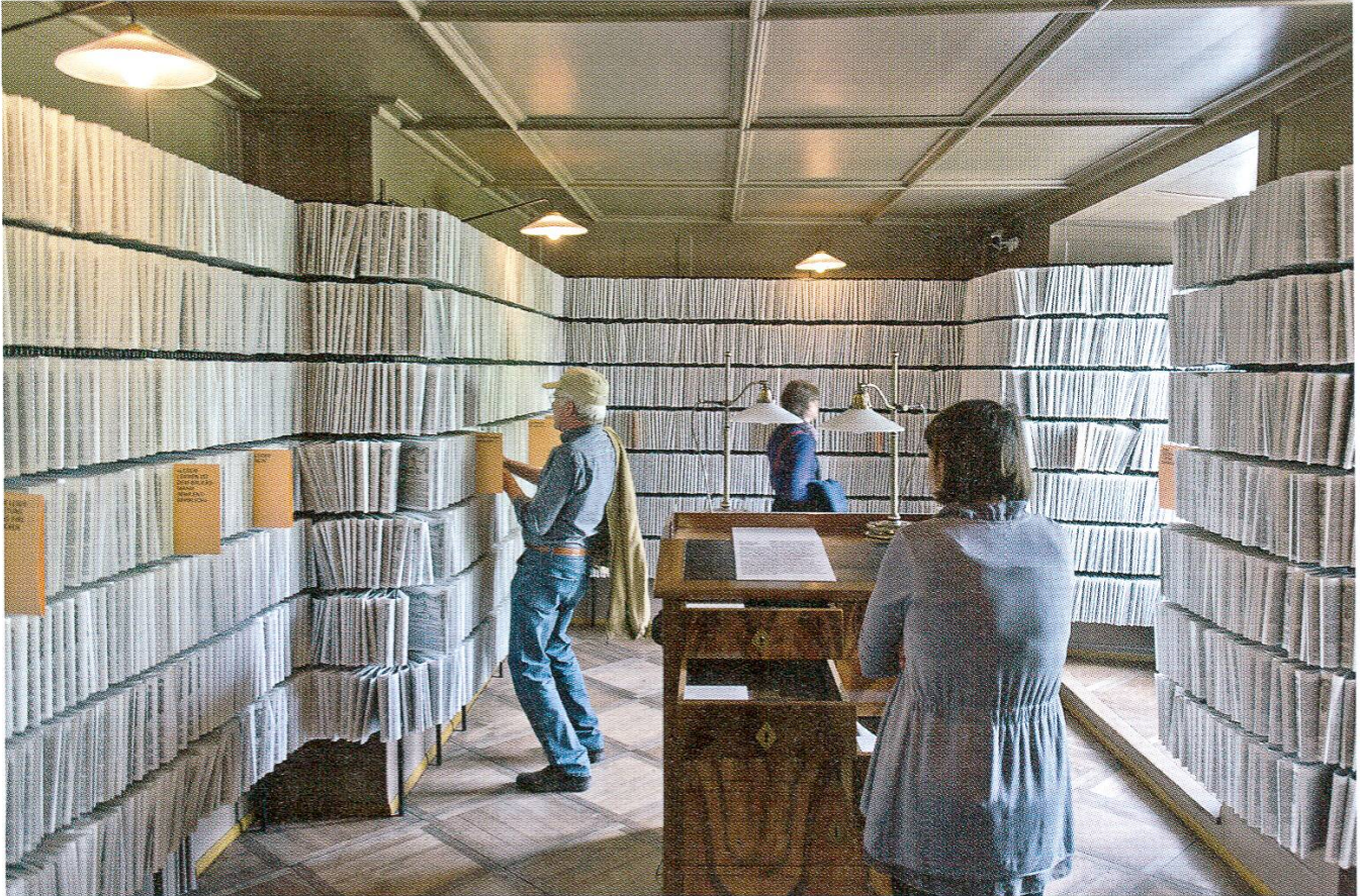
9 Stöbern im «Schweizer Boten» im 2. Obergeschoss.