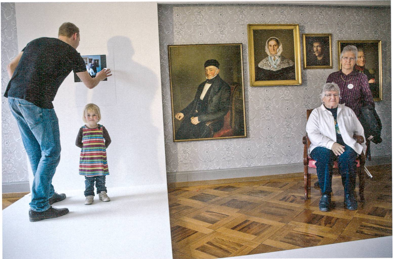
8 Porträts einst und jetzt.