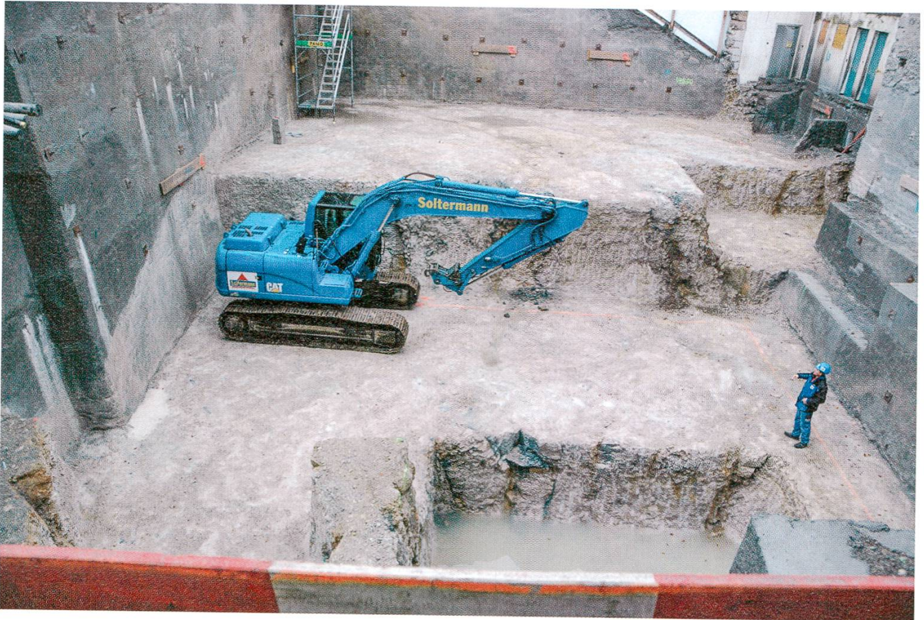
2 Die Baugrube ist ausgehoben.