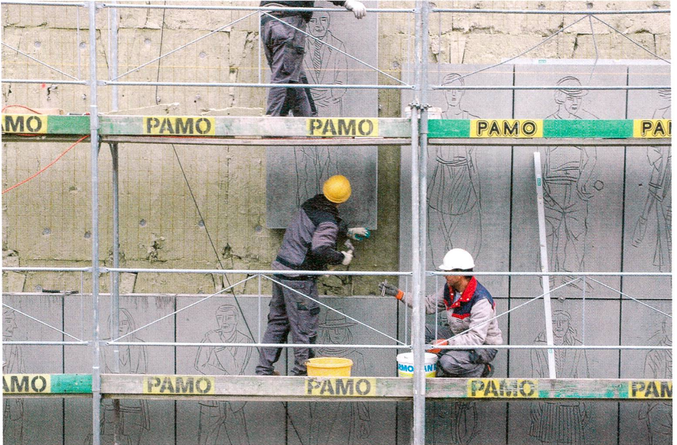
4/5 Josef Felix Müllers Porträts werden montiert.